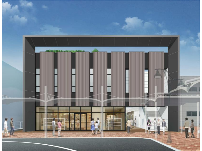
商業施設棟正面ファサードイメージ

※イメージ図は平成 29 年 2 月時点のものであり、変更する可能性があります。