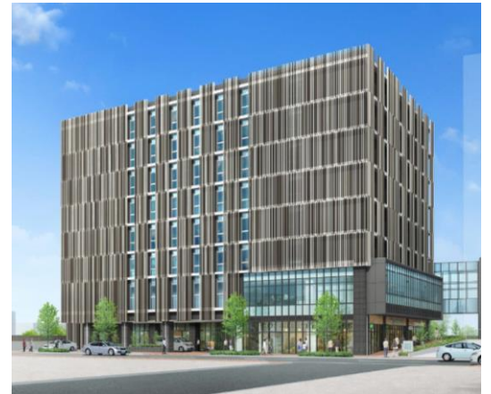
高齢者施設棟外観イメージ

※イメージ図は平成 29 年 2 月時点のものであり、変更する可能性があります。