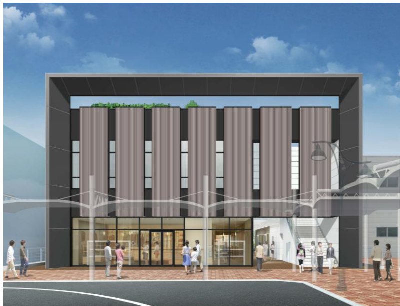
商業施設棟正面ファサードイメージ

※イメージ図は平成 29 年 2 月時点のものであり、変更する可能性があります。